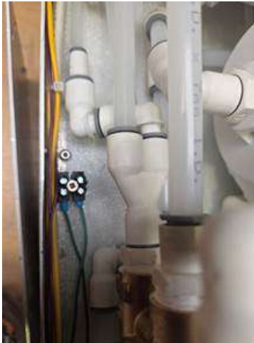
Sensore di perdite Morsettiera nera con 2 cavi Verdi