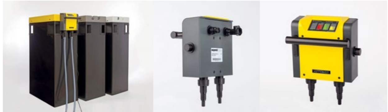
Das KORROSTOP 4.0 ® Messgerät ist nur in Verbindung mit dem E.KO IONISERT ™ zu verwenden.