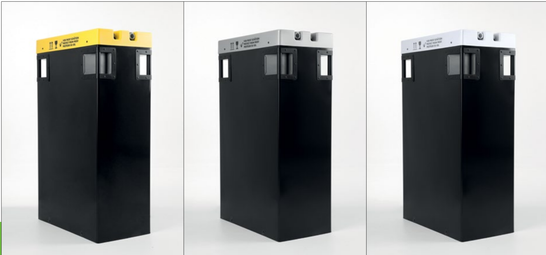
E.KÜ IONISER® 1503